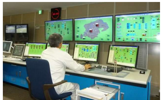
鶴ヶ島浄水場操作室