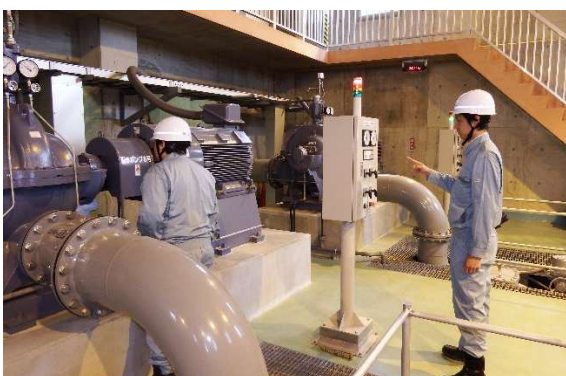
配水ポンプ設備点検