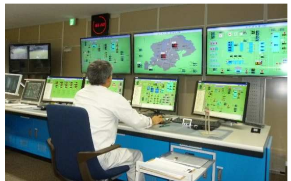
鶴ヶ島浄水場操作室