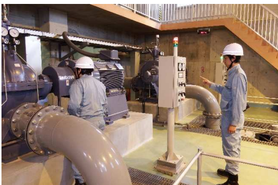
配水ポンプ設備点検