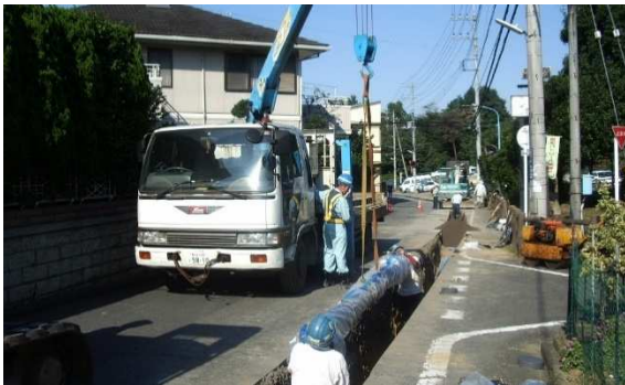
配水本管布設工事